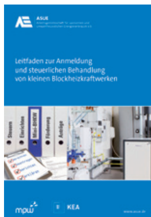
Leitfaden zur Anmeldung und steuerlichen Behandlung von kleinen Blockheizkraftwerken Artikelnummer 30 98 87