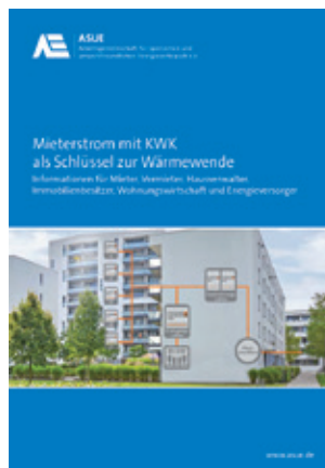
Mietstrom mit KWK als Schlüssel zur Wärmewende Artikelnummer 31 11 67