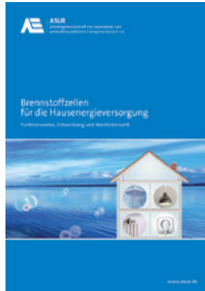
Brennstoffzellen für die Hausenergieversorgung Artikelnummer 30 96 19

Erdgas bleibt ein wichtiger Energieträger, um eine wirtschaftliche und effiziente Wärmeerzeugung zu gewährleisten. Durch die Speicherbarkeit von Gas und die hohe Flexibilität der Wärmeerzeuger kann auch kurzfristig eine hohe Leistung bereitgehalten werden. In Kombination mit einer Wärmepumpe, beispielsweise in einem Hybridgerät, kann eine Gas-Brennwerttherme die Wärmepumpe bei kalten Außentemperaturen sehr gut ergänzen. In Zukunft werden Wasserstoff und Biomethan als speicherbare Energien zur Wärmeversorgung eine zunehmend größere Rolle spielen und können somit gefährliche Strombedarfsspitzen im Winter entschärfen.