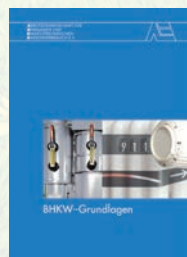
BHKW-Grundlagen Best.-Nr. 06 06 10