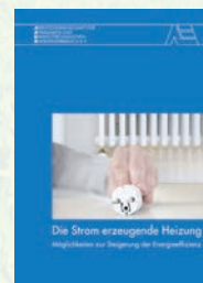
Die Strom erzeugende Heizung Best.-Nr. 05 11 11