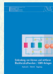
Einbindung von BHKW / KWK-Anlagen Best.-Nr. 07 06 11

Herausgeber ASUE Arbeitsgemeinschaft für sparsamen und umweltfreundlichen Energieverbrauch e.V.