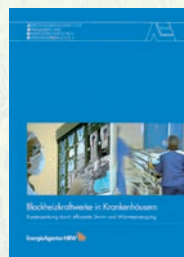
BHKW in Krankenhäusern Best.-Nr. 05 01 10